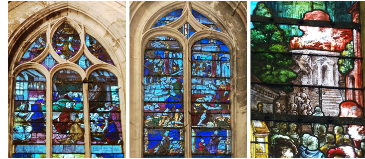
La naissance de saint Jean-Baptiste

Les vitraux de la Renaissance se situent dans les bas-côtés de la nef, mais surtout dans le transept et le déambulatoire. Remarquez La naissance de saint Jean-Baptiste , La décollation de saint Jean-Baptiste , et Saint Michel terrassant le dragon . Les autres vitraux datent de la fin du XIXème siècle et forment un ensemble cohérent de bonne facture. Ils ont été réalisés par des maîtres-verriers du Beauvaisis.